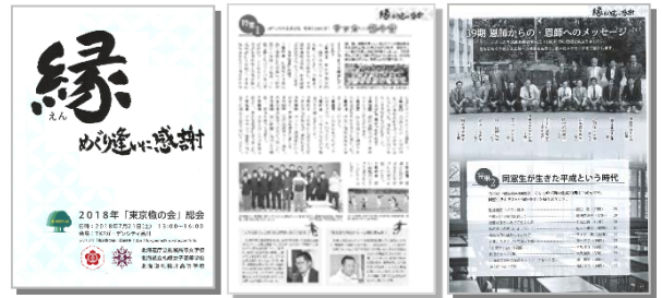
会報誌の例（2018年東京榆の会）